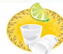
Ravitaillement à l'arrivée