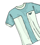
Tee-shirt offert à chaque inscrit