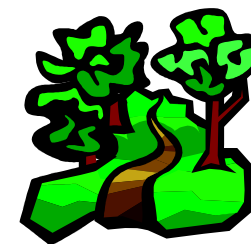
Parcours terre et asphalte