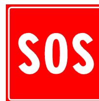
Service de secours sur le parcours